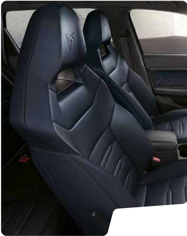
← LEDER IN PETROL-BLAU ODER SCHWARZ