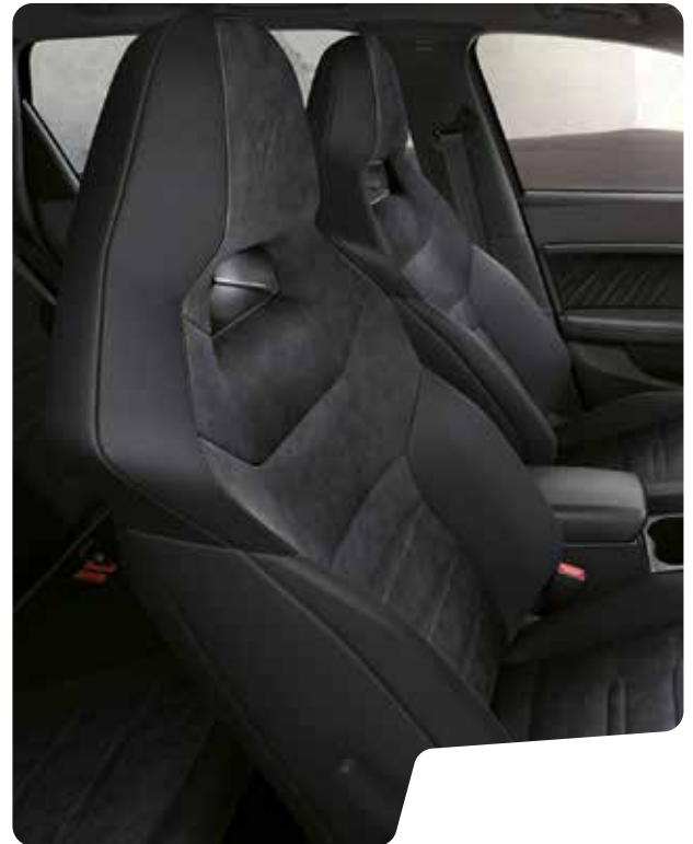
DINAMICA IN SCHWARZ